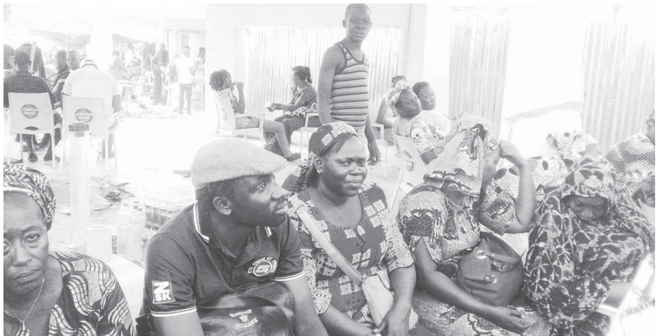
Des ressortissants sénégalais attristés par la perte de plus d'une trentaine de stands d'exposition.

Il est 15h17 lorsque nous arrivons sur le site abritant la foire commerciale et artisanale de la SNC. Une fausse alerte d'incendie attire notre attention. « Un hangar a pris feu », lance quelqu'un, subitement. Deux gendarmes accourent vers le quartier d'où est venue l'alerte. Ensuite, c'est un gros véhicule des sapeurs-pompiers qui se présente. « Vite, vite, déballe la corde », ordonne un des responsables des soldats du feu. Deux agents s'exécutent, mais revient aussitôt avec la corde. « C'est une fausse alerte. Il n'y a pas d'incendie », font-ils savoir. La curiosité de certains exposants qui avaient abandonné leurs commerces ne sera donc pas satisfaite. Et c'est tant mieux, selon un visiteur qui a déploré les installations anarchiques de certaines vendeuses de brochettes, qui se permettent de faire la cuisine sur l'aire de la foire. Plus loin, vers le quartier « lotie », des commerçants s'activent à ouvrir leurs commerces. « Nous avons certes eu l'accès à la foire, depuis le matin, mais nous sommes restés à constater d'abord. C'est maintenant que nous ou-