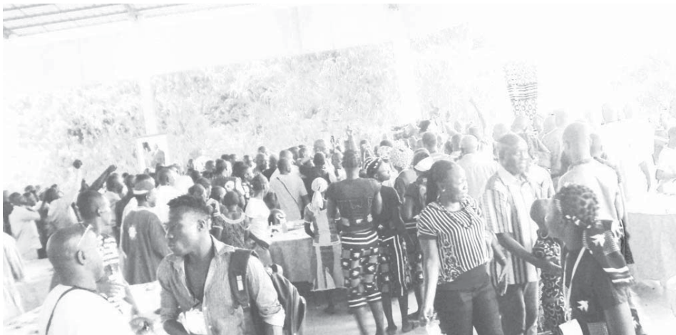
Les artistes ont fait le déplacement pour honorer l'invitation du président