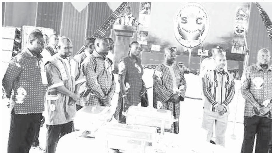
Roch Marc Christian Kaboré (à l'extrême droite) a pris de nombreux engagements en faveur des artistes.

ger », a fait savoir le président du Faso. Pour joindre l'acte à la parole, il a pris l'engagement solennel de créer les conditions propices à l'expression et au rayonnement des talents des artistes. Il a également promis de renforcer les capacités des acteurs, d'organiser régulièrement des salons thématiques, de valoriser la production artistique, de créer un mécanisme pour repérer les jeunes talents musicaux. Ces derniers bénéficieront des facilités d'accès aux structures de formation et d'encadrement, pour se perfectionner. A l'issue de ces formations, des bourses seront octroyées aux plus méritants, pour des stages dans des structures. L'amélioration, la disponibilité et l'accessibilité des infrastructures culturelles sont autant d'engagements pris par le chef de l'Etat. Le dîner a été agrémenté par des prestations remarquables des sourds-muets de Bobo-Dioulasso et bien d'autres artistes.