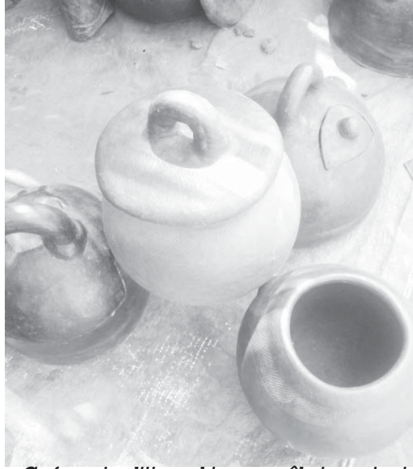
Ce foyer traditionnel joue un rôle important dans la culture gourounsi.