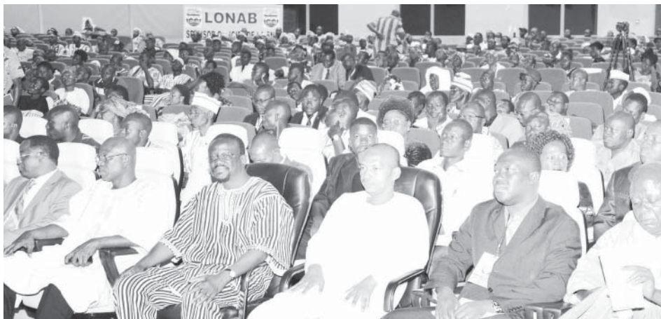
Des membres du gouvernement et des députés (premier plan) ont été témoins de la remise des prix spéciaux de la 18 e édition de la SNC

Le 1 er vice-président de l'Assemblée nationale, Maître Bénéwendé Stanislas Sankara, a présidé vendredi 1er avril 2016 à Bobo-Dioulasso, la séance de remise des prix spéciaux de la 18 e édition de la Semaine nationale de la Culture (SNC). Six millions de franc CFA, c'est la valeur totale des prix remis à 13 lauréats, qui se sont illustrés dans différentes disciplines.