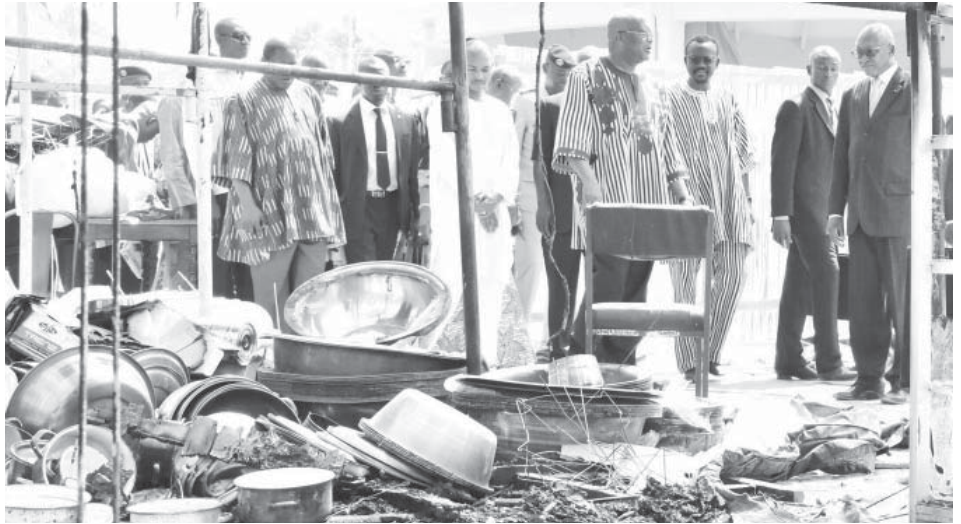
Sur le site de la foire commerciale, le président Roch Marc Christian Kaboré a pu constater l'ampleur des dégâts.