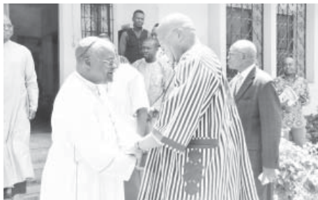
Le chef de l'Etat a rendu une visite de courtoisie aux autorités coutumières et religieuses de Bobo-Dioulasso